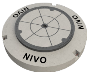
Figur N480 Figur N486 Figur N489