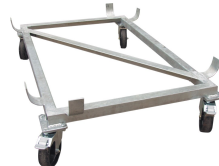
7817 - Lenkrollengestell kpl. *** für REB 550 l ***