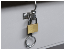
1490 - Vorhängeschloss, verzinkt gleichschliessend