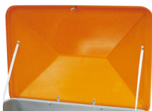
10904 - Vandalismus-Deckel ohne Sicken, 550/700 dachf., orange, mit Scharnierbügel ****