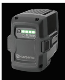
AKKU BLI300 967 07 19-01