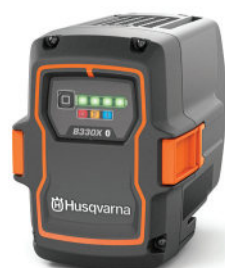
AKKU 40-B330X 970 60 77-01