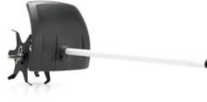
CA230 MOTORHACKE 967 29 42-01