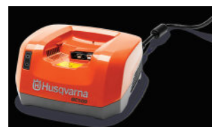
AKKU-LADEGERÄT QC500 970 44 95-06