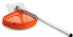
BCA850/24 DICKICHTMESSER 967 18 59-02