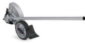
KANTENSCHNEIDER 967 92 56-04