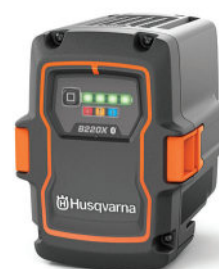
AKKU 40-B220X 970 60 78-01