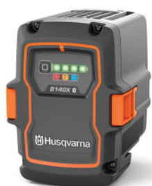
AKKU 40-B140X 970 60 79-01