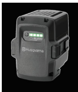
AKKU BLI200 967 09 19-01