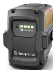
AKKU BLI200X 970 44 89-01