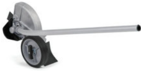
KANTENSCHNEIDER 967 92 55-04