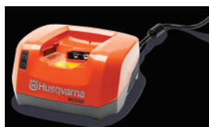
AKKU-LADEGERÄT QC330 970 52 22-06