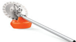
RA850 KREISELSCHERE 967 90 85-01