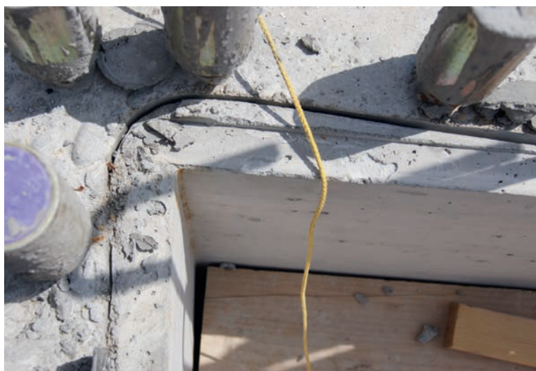
Nach dem Rausziehen hinterlässt rostband eine schmale Fuge, die kurzzeitig als Wasserrinne dient.