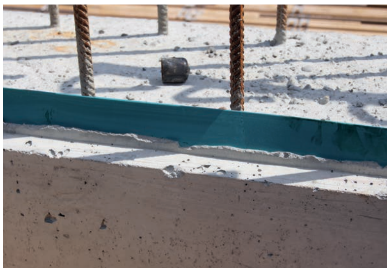
rostband zwischen Bewehrung und Wandschalung in den weichen Beton stecken.