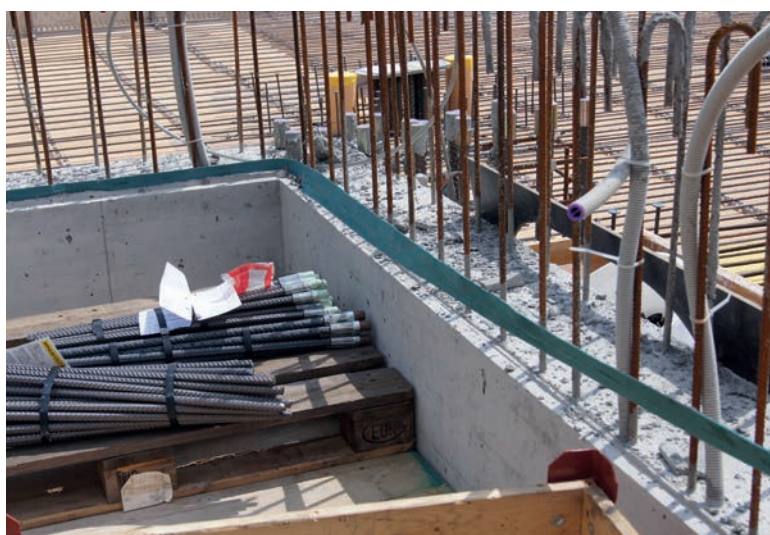
Vor der nächsten Schalungsetappe einfach rauszuziehen.