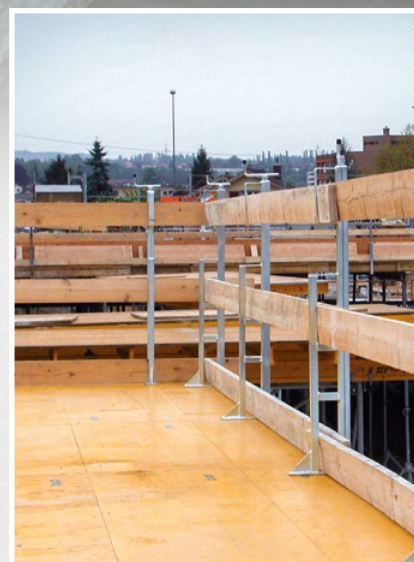
Kurbelpfosten 1.00 m