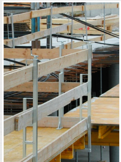
Kurbelpfosten mit Eckausbildung