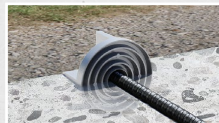
Der Kunststoffzapfen dient zudem als Wassersperre