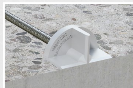
Der Kunststoffzapfen ermöglicht den Einsatz bei Sichtbeton