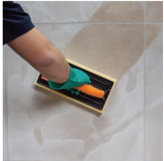
Sehr leichtes angenehmes Waschen, kein Aufbrennen.