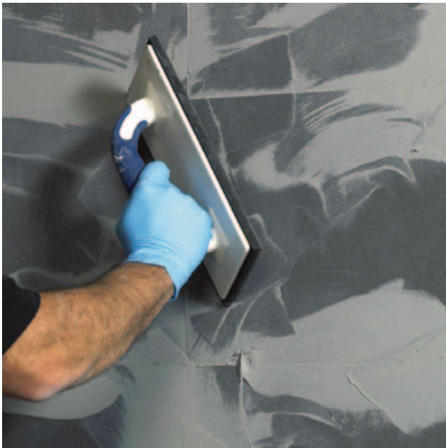
Geschmeidiges, leichtes Einfugen mit einem Verarbeitungsfenster von ca. 40 Minuten.

4 Nach dem Abtrocknen den verbleibenden Mörtelschleier mit einem leicht feuchten Schwamm entfernen.